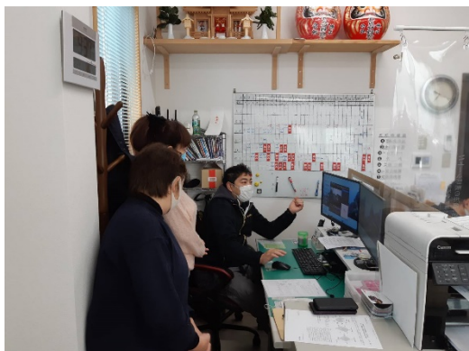
ドライブレコーダーを使った講習

事故防止、車両の特性、接遇、健康管理の知識等に関する講習を入社時に実施しています。(実技20時間以上座学10時間以上) 大型車両特有の知識を習得、指導員による教習・ベテラン運転士の指導による実車訓練を実施するほか、定期的にフォローアップを実施し、技術力アップにつなげ事故防止を図っています。